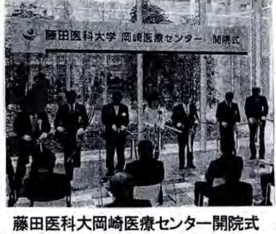
藤田医科大学岡崎医療センター開院式

元祖二刀流93歳で 関根潤三。プロ野球近鉄元投手・野手。のち大洋、ヤクルト監督。4月9日、老衰のため死去。93歳。東京都出身。法大時代41勝左腕。プロ通算65勝94敗。1937安打・打率2割7分9厘。初代二刀流。球宴5度出場。65年引退。03年殿堂入り。