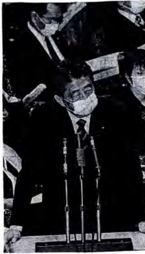
閣僚席のみなさん、アベノマスクお気に入りのよう

コロナ感染急増、都市封鎖、医療崩壊が世界から報じられる4月1日、日本が打ち出した策は「マスク2枚全戸配布」。マジでエプリルフルじゃない。医療機関がマスク、防護具・防護服、消毒液がないと悲鳴の中、2枚で400円のマスクを2枚400円 466億円で配る