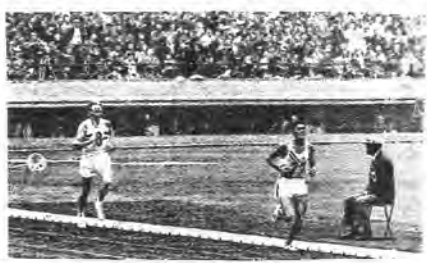
立ち上がり、ガンバレ円谷

1964年東京大会の思い出は圧倒的に「女子バレー」と「マラソン・円谷」。ほかには？ 半世紀前の記憶をたぐってもらった。