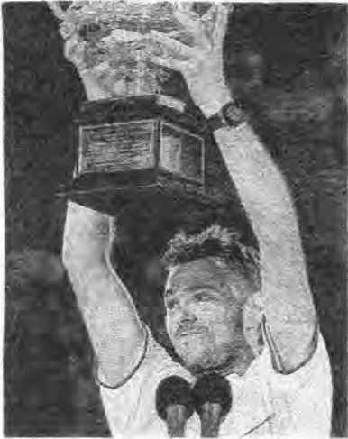
ナダルに初勝利、全豪初優勝したワウリンカ

◆スタニスラス・ワウリンカ＝フェデラーに次ぐスイスのNO.2。テニス歴20年、02年プロに。03年全仏ジュニアV。06年クロアチア・オープンでツアー初V。北京五輪でフェデラーと組み複「金」。183cm・81kgのガッチリ型。武器は220°サーブ。ランク躍進3位。