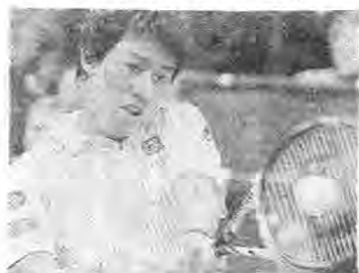
全米室内2連覇を果たした錦織

デ杯後、世界16位・錦織(24歳)は全米室内「テネシー州メンフィス」に第1シードとして出場。前回は決勝でロベス(スペイン)に快勝してツアー3勝目を挙げていた。2回戦で過去1戦1敗のベイヤミン・ベツカ(独)を6-4、6-4で下して準々決勝に進出。ポゴモフ(ロシア)を9-8位のラッセル(米)を6-3、6-2で下して決勝へ。相手は世界最速サーバー、80位のカロビッチ(クロアチア)。これまで2倍8センチの長身からの高速サーブに押されて勝てなかったが、今回はサーブを続け、6-4、7-6で勝利。V2達成、ツアー4勝目。