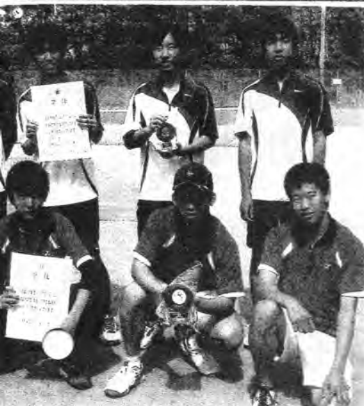
の栄徳A(前)と準優勝の長久手A(後)