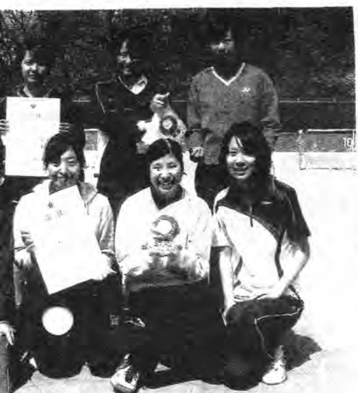
の旭野A(前)と準優勝の聖霊A(後)